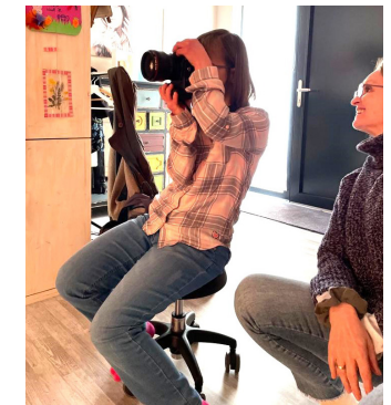
Foto-Workshop mit Profis