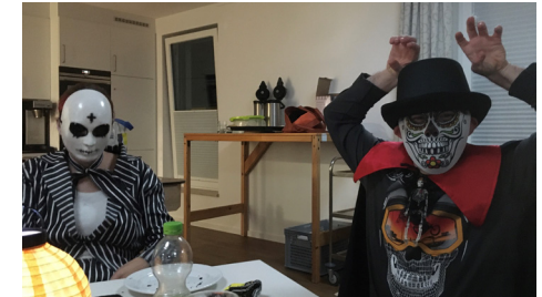
Auf der Halloween-Party