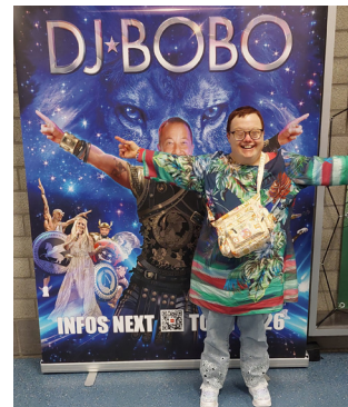
Bei DJ Bobo in Mannheim